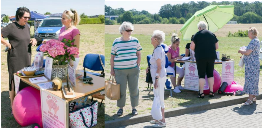
One life-Madlens Reiki & Massagepraxis