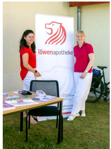
Löwen-Apotheke - Ernährungsberatung