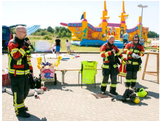
Freiwillige Feuerwehr Pampow Einsatzvorbereitung und Gefahren im Alltag