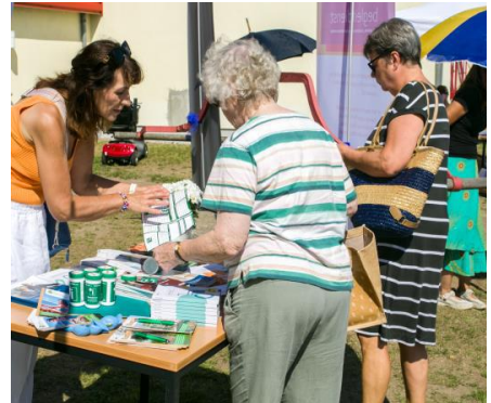
Begleitung in schweren Lebenslagen