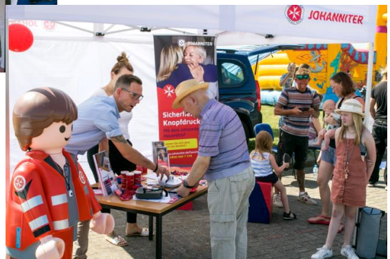
Johanniter Erste-Hilfe-Kurs und Notruf