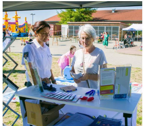
Polizei Ludwigslust - Kriminalprävention