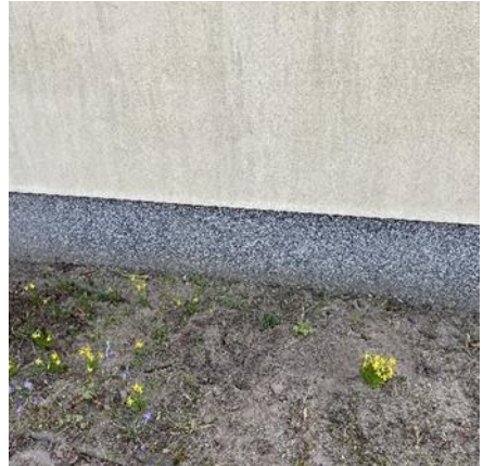
Dieses Jahr mit Loch