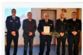
Aufnahme in die Ehrenabteilung