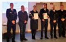
Beförderung zur/m Hauptfeuerwehrfrau/-mann