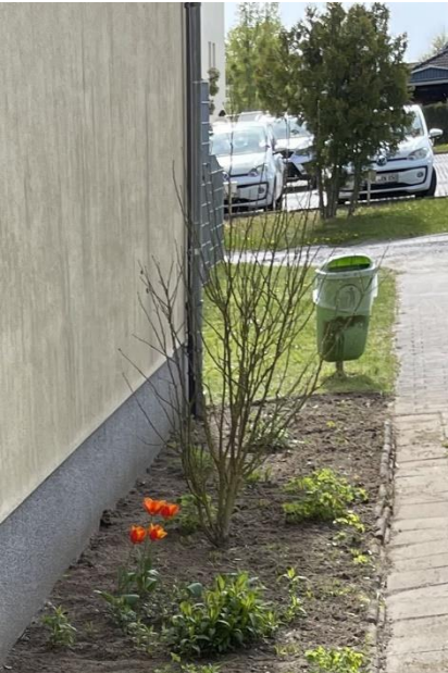
Letztes Jahr mit Hibiskus

Wenn Ihnen etwas aufgefallen ist, melden Sie sich gerne bei mir in der Bibliothek oder im Gemeindebüro.