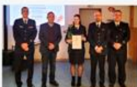
Beförderung zur Oberfeuerwehrfrau