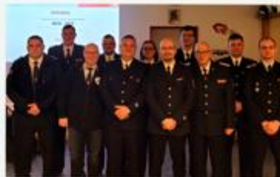
Wehrvorstand 2018 - 2024