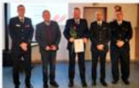
Beförderung zum Feuerwehrmann