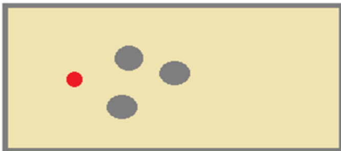
Spielfeld 5x12 Meter

unser Senioren- und Behindertenbeirat möchte in der Gemeinde einen Boule-Platz für den Freizeitsport etablieren. Boule ist ein Outdoor-Spiel, welches mit Kugeln zwischen 500 und 1400 Gramm auf einem dafür geeigneten Untergrund „Boule-Platz“ gespielt wird.