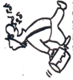
NA HUUS GANN!!!