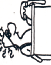
DOOF KECKEN UN NIX WUSST