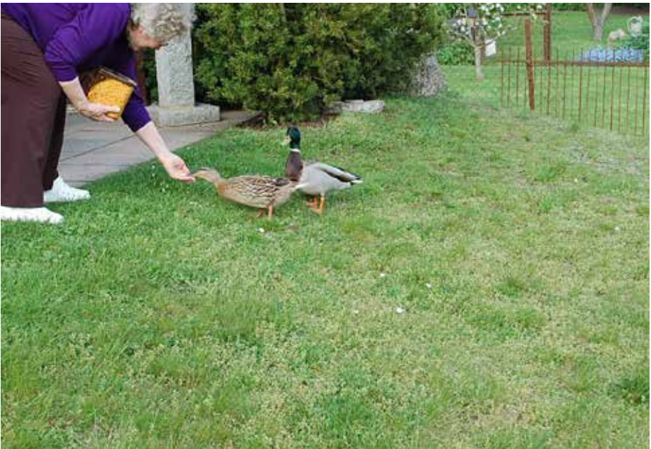
Das Entenpärchen bei der liebevollen Fütterung

Bild und Text: Karl Langhals, Pastor i.R.