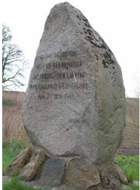
Die Sagsdorfer Gedenkstätte erinnert an die Zeit des „Umdenkens“